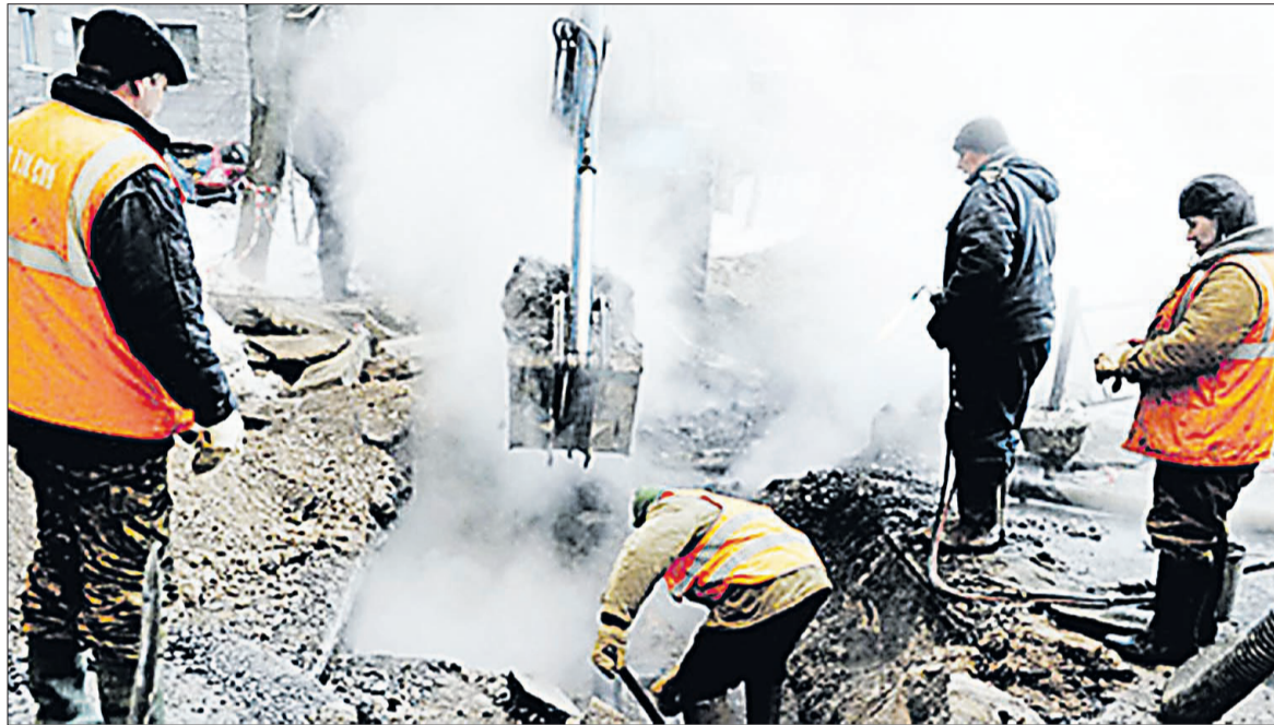
Все службы в период ликвидации аварии обычно мобилизуются.

Взволнованная жительница города Строителя позволила в ЕДДС Яковлевского городского округа утром. Женщина объяснила, что в помощи нуждается её кот. Домашний питомец застрял на крыше двухэтажного здания. Оперативная обстановка позволила в это время спасателям осуществить выезд на помощь к животному. К месту прибыл дежурный караул пожарно-спасательной части №36.